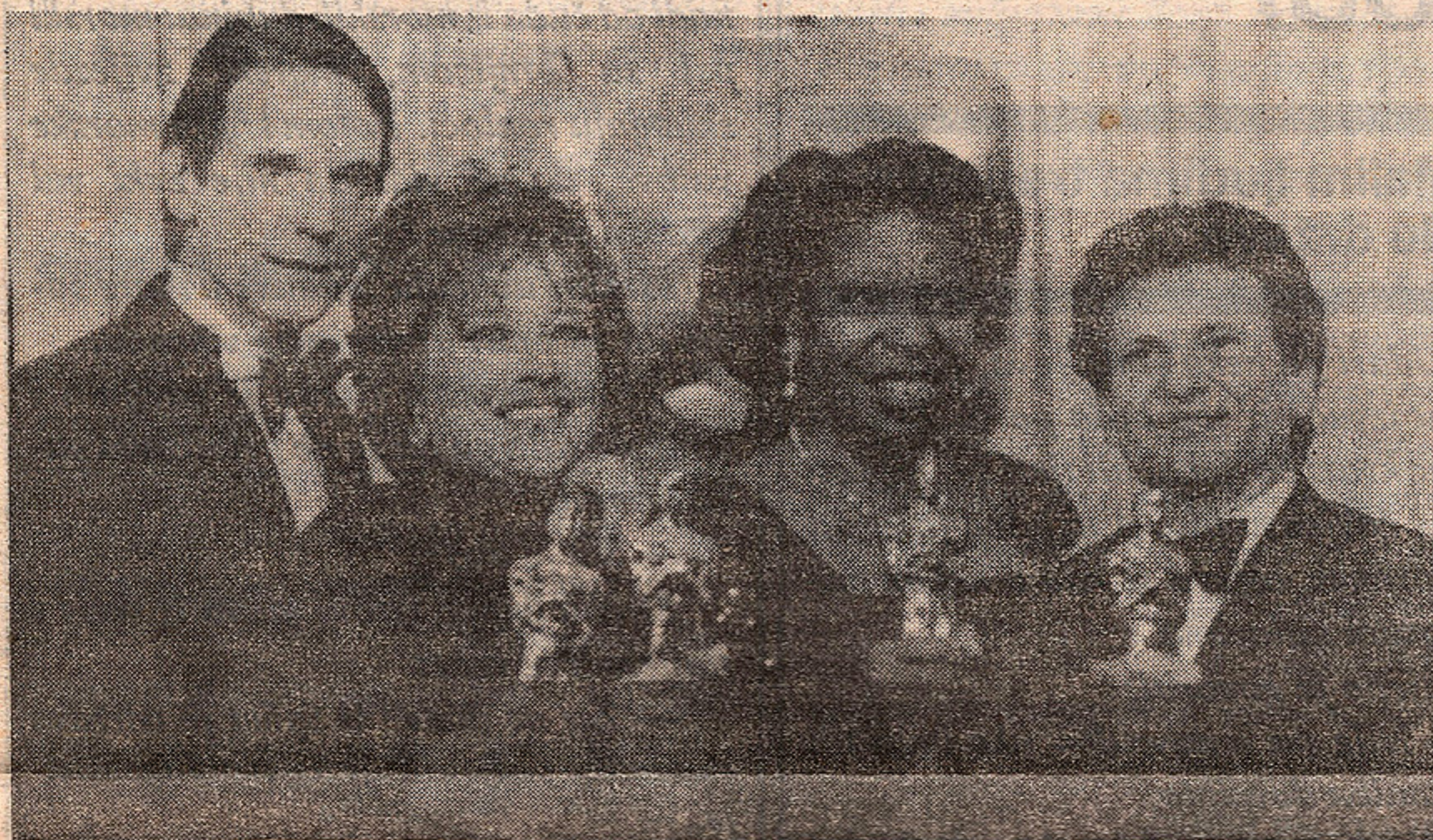
ČETIRI »OSKAROVSKA« ASA: DŽEREMI AJRONS, KETI BEJTS, VUPI GOLDBERG I DŽOE PEŠI

Bila je to noć zvijezda kakvu samo Holivud može i zna da priredi. Voditelj ceremonije Bili Kristal na pozornicu je ujahao na konju, simbolično najavljujući trijumf vesterna u 63. po redu »oskarovskoj« trci. Na gala-priredbi u auditorijumu »Šrajn«, koju je na malim ekranima pratila milijarda gledalaca širom svijeta, sjatila se elita šou—biznisa. Bio je tu i naše gore list Karl Malden — aktuelni predsjednik Američke filmske akademije, Gregori Pek, Tom Kruz, Debra Vinger, Ričard Gir, Glen Klouz, Majkl Džonson, Džon Bon Džovi, Kim Besindžer... Samit zvijezda nije mogao proći ni bez Madone, koja je otpjevala pjesmu »Prije ili kasnije« iz filma »Dik Trejsi«, nagrađenu »Oskarom«.